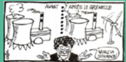
Le Canard Enchaîné 23.04.08

Oui, réduisons le nucléaire autant que possible ! Mais il n'y a pas de réduction du nucléaire à l'horizon : la Programmation Pluriannuelle de l'Énergie prévoit en 2028 le même niveau d'énergie nucléaire qu'aujourd'hui, les énergies renouvelables ne seront qu'un complément. Nous aurons donc autant de nucléaire, le mitage éolien en plus ! Le remplacement du nucléaire (énergie constante) par l'éolien (énergie intermittente) n'est techniquement pas possible à l'échelle du pays. L'éolien industriel, présenté comme une solution au problème nucléaire, est devenu la caution du nucléaire !